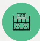
SMART SILVER LAB

Inovacijų programa sudaryta iš 6 Baltijos jūros regiono šalių ekspertų tinklo. Svarbų vaidmenį programoje atliks mokslinių tyrimų organizacijos ir verslo paramos įmonės. Smart Silver Lab koordinuos ir įgyvendins Lietuvos Akseleravimo programą, suteikdama galimybę naudotis visais techniniais, technologiniais ir logistiniais išteklių, kurių reikia inovacijų programos dalyvių projektams.